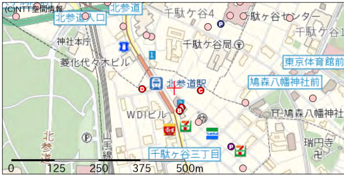
ボーリング地点 (A, B, C, D)