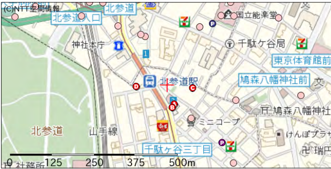
ボーリング地点（A, B, C, D）