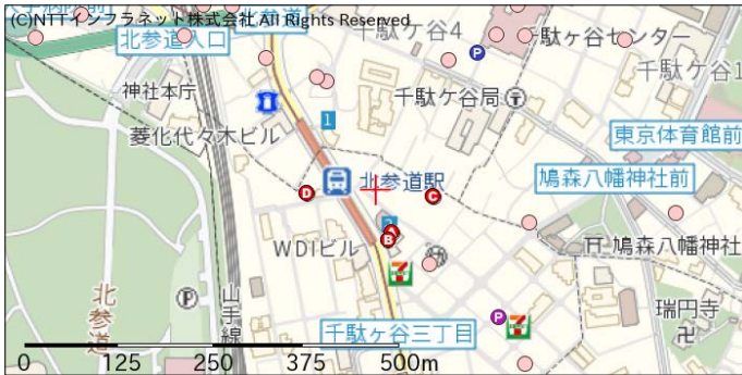
ボーリング地点 (A, B, C, D)